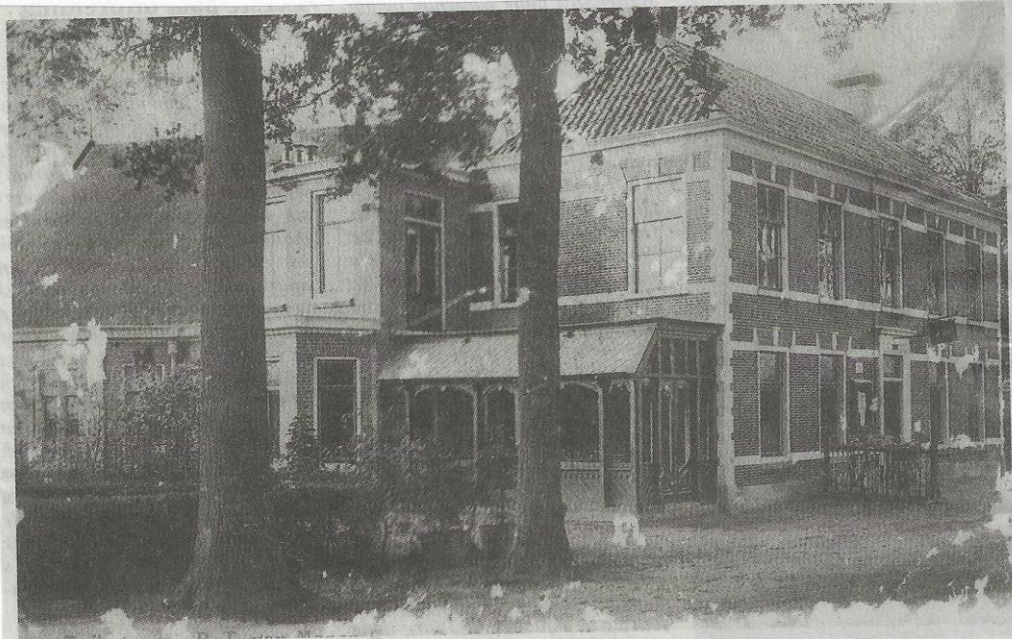
"De Drie Witte Kannen" was een fraai gebouw. Eeuwenlang heeft het een functie gehad in de dorpsgemeenschap.